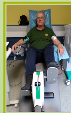
Utilisation du pédalier au centre de dialyse Santély de Viriat

Le verdissement du département se poursuit avec la plantation de 2 arbres de vie : à Saint-Jean-sur-Reyssouze et Douvres. Nous allons déployer nos efforts pour essayer d'agrandir la pépinière dans le Bugey.