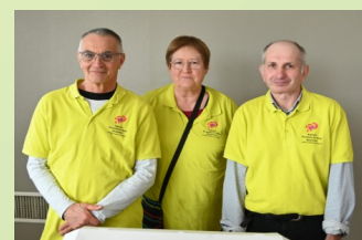
Amicalistes de Polliat

Pour leurs subventions, merci au Conseil Départemental et aux communes de Bourg-en-Bresse, Divonne-les-Bains, Feillens, Groissiat, Montluel, Montrevel-en-Bresse, Neyron, Saint-Didier-d'Aussiat. C'est grâce à ces subventions que le fonctionnement de France ADOT 01 est assuré.