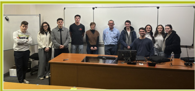
Intervention scolaire à l'IUT Lyon 1 à Bourg-en-Bresse

Le 1 er trimestre est traditionnellement marqué par notre participation aux AG des différentes associations partenaires et notamment les Amicales de Donneurs de Sang. S'y ajoutent les interventions scolaires particulièrement nombreuses en ce début d'année, ce qui est très encourageant pour le bilan annuel. Dans le même esprit de sensibilisation, nous sommes intervenus auprès d'un groupe de sportifs du club Cycling Team 01 (U19) que nous sponsorisons.