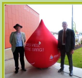
A l'AG de l'UD des donateurs de sang bénévoles à Oyonnax