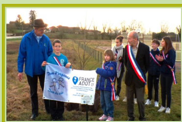
Arbre de vie de Saint-Jean-sur-Reyssouze

Le verdissement du département se poursuit avec la plantation de 2 arbres de vie : à Saint-Jean-sur-Reyssouze et Douvres. Nous allons déployer nos efforts pour essayer d'agrandir la pépinière dans le Bugey.