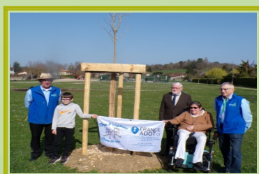
Arbre de vie de Douvres