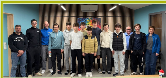
Sensibilisation d'une équipe de la Cycling Team 01

Grâce à nos donateurs privés (adhérents, associations, entreprises), nous avons pu mener à bien un projet qui nous tenait à cœur : l'achat de 3 malles de casques de réalité virtuelle à destination des centres de dialyse SANTELYS de Viriat et Ambérieu-en-Bugey, AURAL d'Oyonnax et celui du CHB Fleyriat. C'est avec beaucoup d'émotion que nous avons mis ce matériel à la disposition des centres. Nous avons également assuré la formation des personnels médicaux à leur utilisation. Les 1 er retours des patients sont encourageants. Nous espérons pouvoir vous communiquer très bientôt des témoignages de patients qui les utilisent ainsi que les pédaliers de lit.