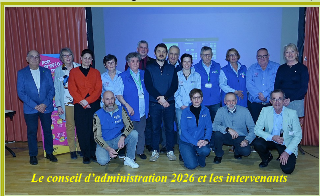
Le conseil d'administration 2026 et les intervenants

Clôture de la 44 ème assemblée générale suivie par un vin d'honneur convivial. L'assemblée générale 2027 se déroulera (sous réserve) le samedi 13 mars à Foissiat (01).