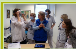
Remise du casque au centre de dialyse du CHB Fleyriat