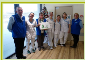
Remise du casque et formation au centre de dialyse AURAL d'Oyonnax

Grâce à nos donateurs privés (adhérents, associations, entreprises), nous avons pu mener à bien un projet qui nous tenait à cœur : l'achat de 3 malles de casques de réalité virtuelle à destination des centres de dialyse SANTELYS de Viriat et Ambérieu-en-Bugey, AURAL d'Oyonnax et celui du CHB Fleyriat. C'est avec beaucoup d'émotion que nous avons mis ce matériel à la disposition des centres. Nous avons également assuré la formation des personnels médicaux à leur utilisation. Les 1 er retours des patients sont encourageants. Nous espérons pouvoir vous communiquer très bientôt des témoignages de patients qui les utilisent ainsi que les pédaliers de lit.