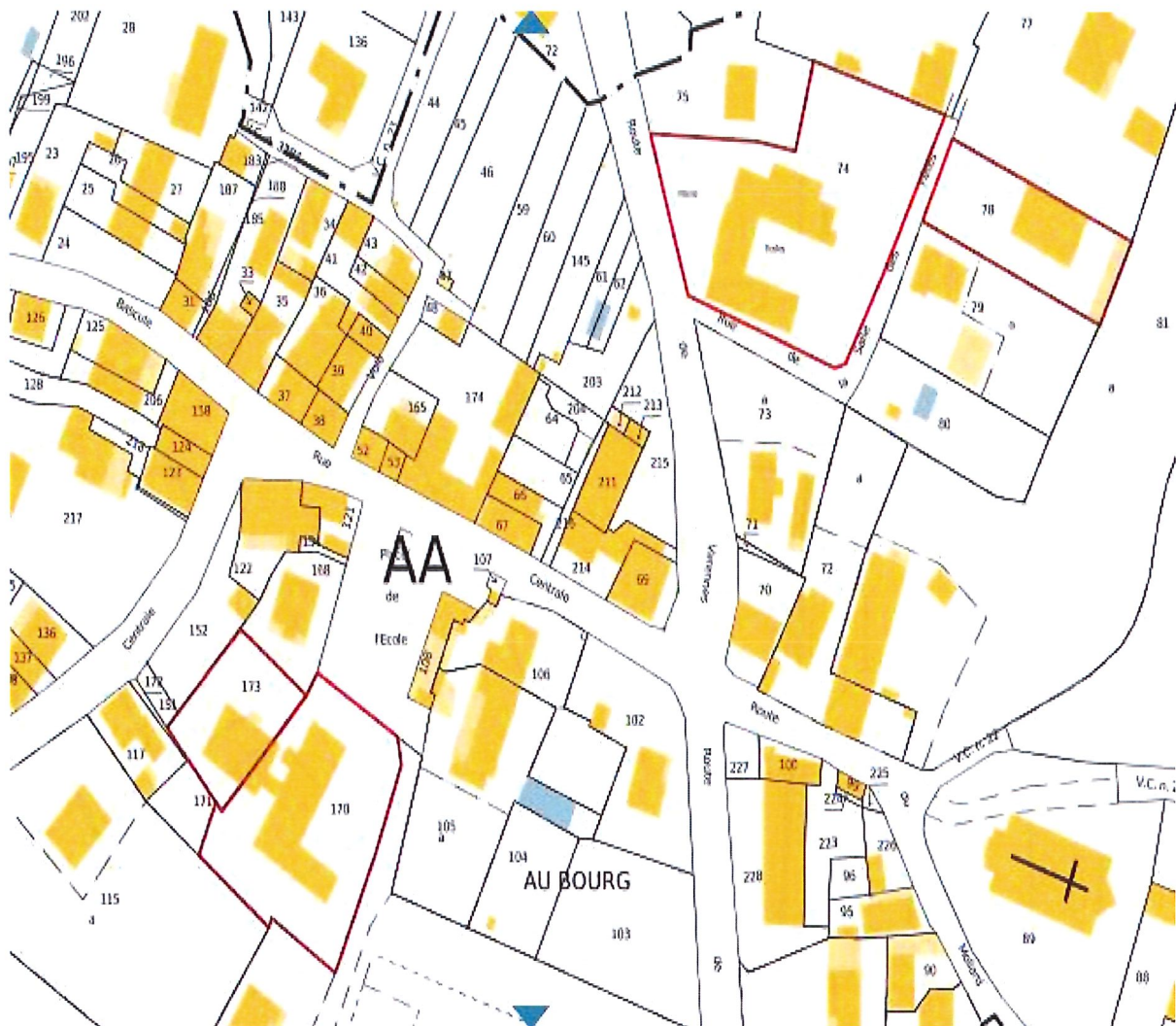
Parcelles cadastrées : AA 78, AA 74, AA 170, AA 173. Lieu-dit : Le Bourg

Légende : Délimitation de la ZAENR – Filière Photovoltaïque sur bâtiment [ ]