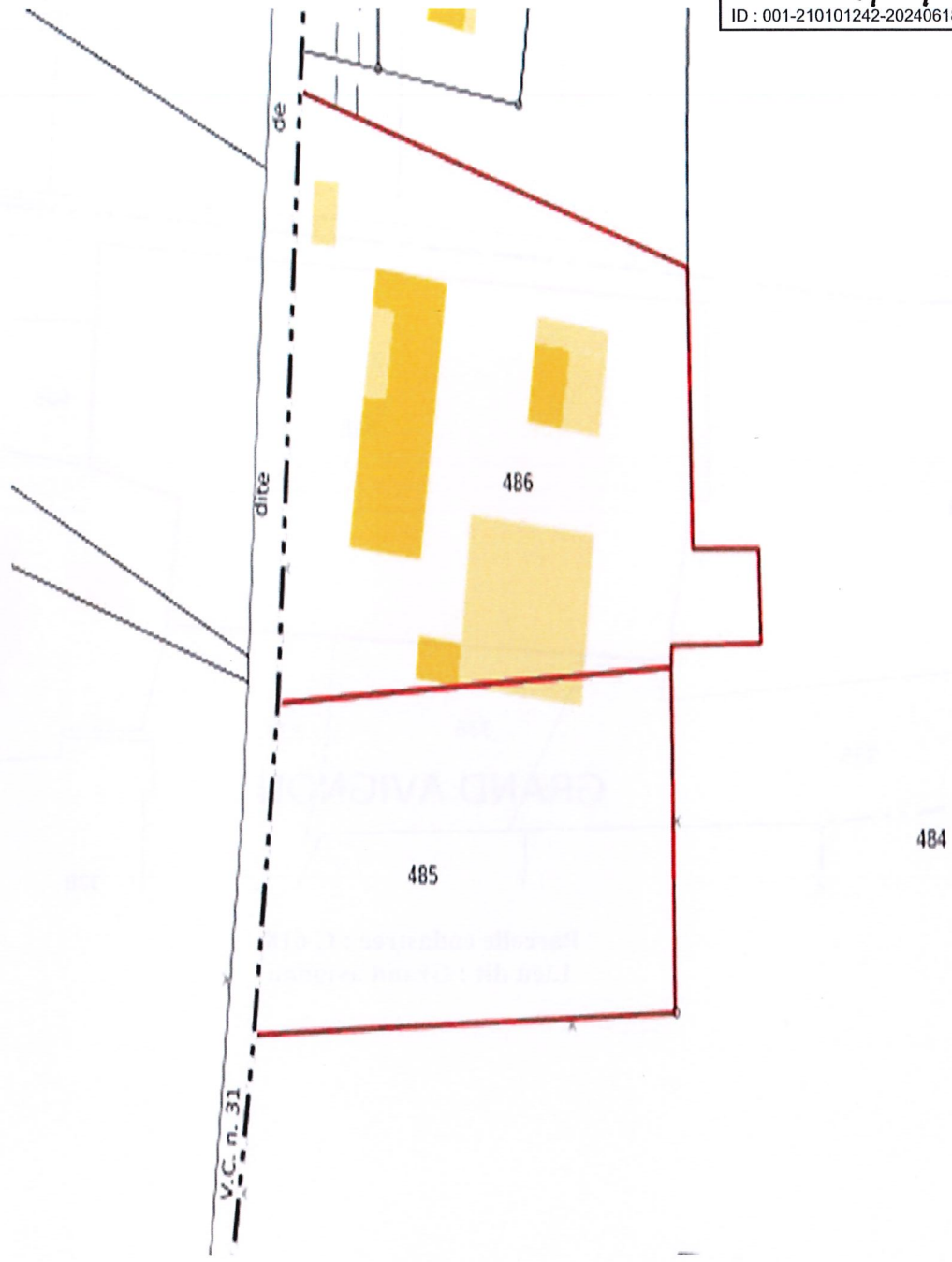
Parcelles cadastrées : C 486, C 485 ; Lieu dit : La verne

Envoyé en préfecture le 27/06/2024 Reçu en préfecture le 27/06/2024 Publié le 27/06/2024. ID : 001-210101242-20240618-D2024_039-DE