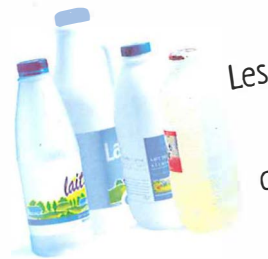
Les bouteilles de lait, de soupe...