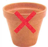
Pots de fleurs