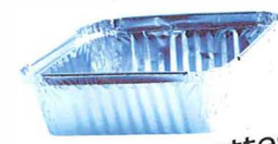
Les barquettes en aluminium