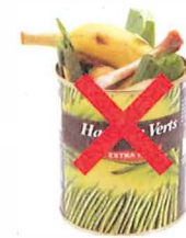
Boîtes de conserve contenant des restes