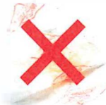
Papiers salis ou gras