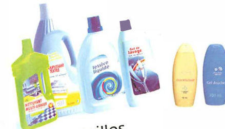
Les bouteilles d'adoucissant, de lessive, de liquide lave-vaisselle, de javel, de nettoyant ménager, flacons de toilette...