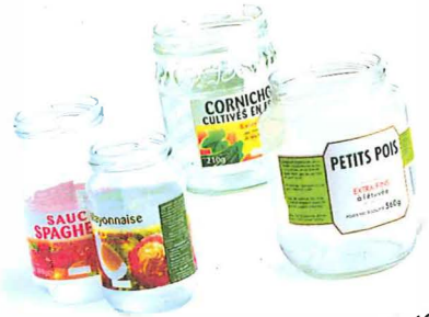
les bocaux de conserve