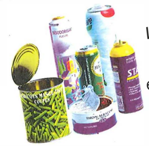
Les boîtes de conserve et les boîtes de boissons. Les aérosols et les bidons