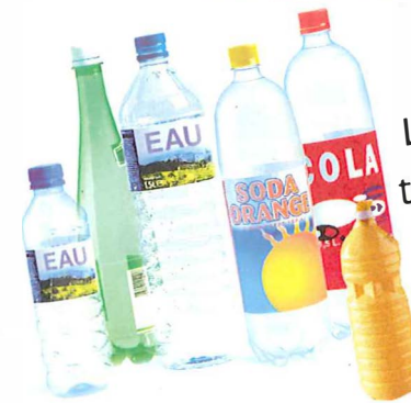
Les bouteilles transparentes : eau, jus de fruits, soda...

Bouteilles et flacons en plastique, briques alimentaires, boîtes