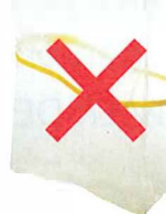
Films en plastique enveloppant les revues