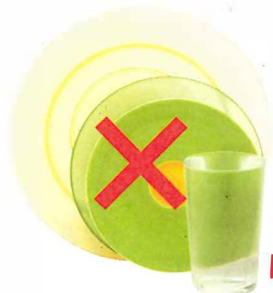
Vaisselle, Faïence, Porcelaine