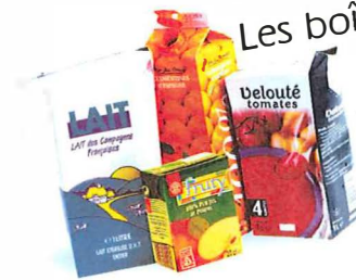
Les briques alimentaires Les boîtes et sur-emballage en carton