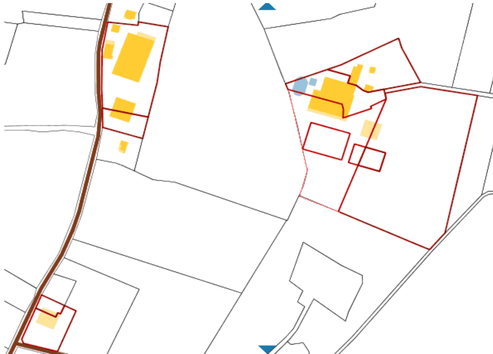
Parcelles cadastrées : ZM 130, ZM 163, ZM 66, ZM 164, ZM 156, ZM 154, ZM 138, ZM 131, ZM 165, ZM 166, ZM 167 ; Lieu dit : Chamandray & Grosbuis